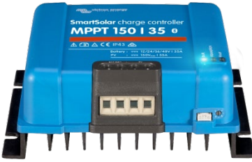
SmartSolar Şarj Kontrol Birimi MPPT 150/35