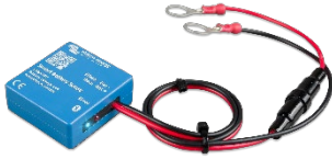
Bluetooth tespiti Akıllı Akü Hassasiyeti