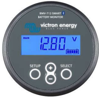
Bluetooth tespiti BMV-712 Smart Akü Monitörü